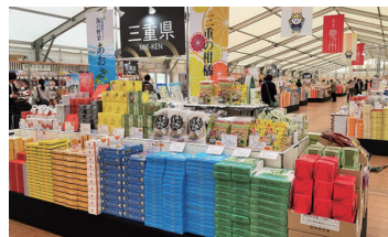
2017年の三重「お伊勢さん博覧会」の様子