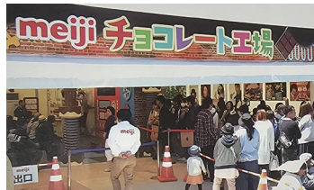
2017年の三重「お伊勢さん博覧会」の様子

ゲームや珍しいお菓子のサンプリングなど、大人も子どもも楽しめる参加・体験型メーカーブースです。