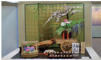
2017年の三重「お伊勢さん博覧会」の様子