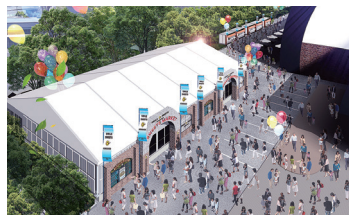
あさひかわ菓子博 2025 イメージ