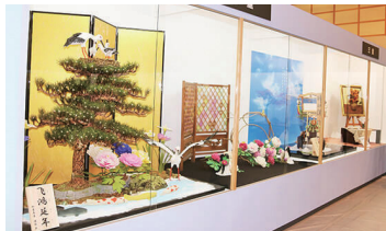
2017年の三重「お伊勢さん博覧会」の様子

全国の菓匠（菓子職人）達が伝統の技を駆使して制作した、大型工芸菓子を一堂に集めて展示。