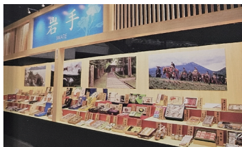
2017年の三重「お伊勢さん博覧会」の様子