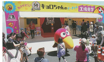
2017年の三重「お伊勢さん博覧会」の様子