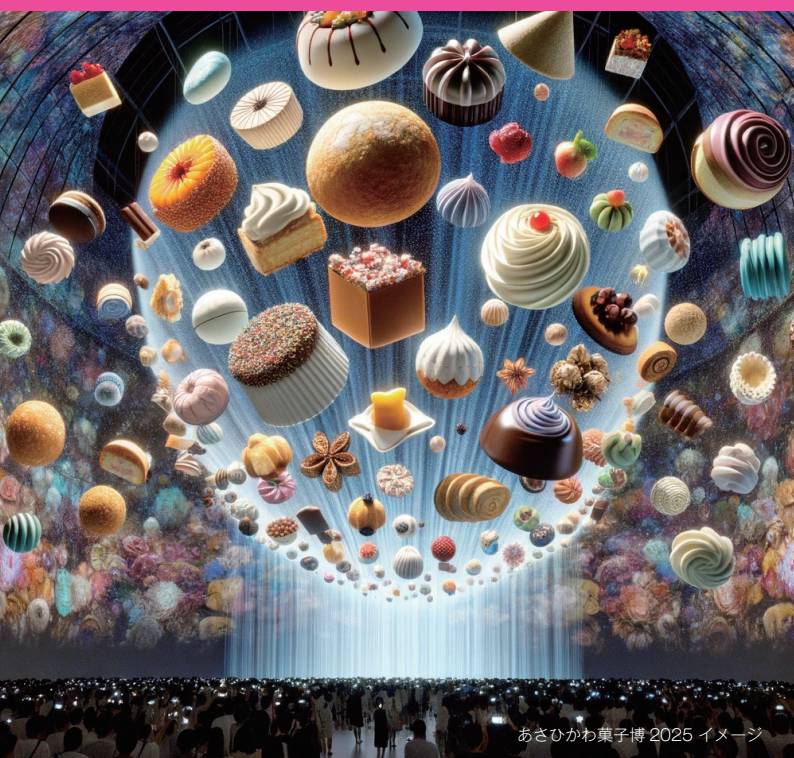
あさひかわ菓子博 2025 イメージ