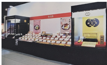
2017年の三重「お伊勢さん博覧会」の様子